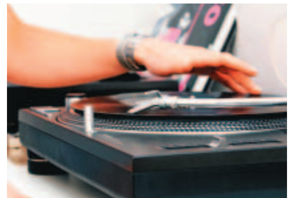
... Fotoshooting im Aachener Krönungssaal, beim Caipirinha mixen oder Platten auflegen – Sonja Bolz ist dabei.