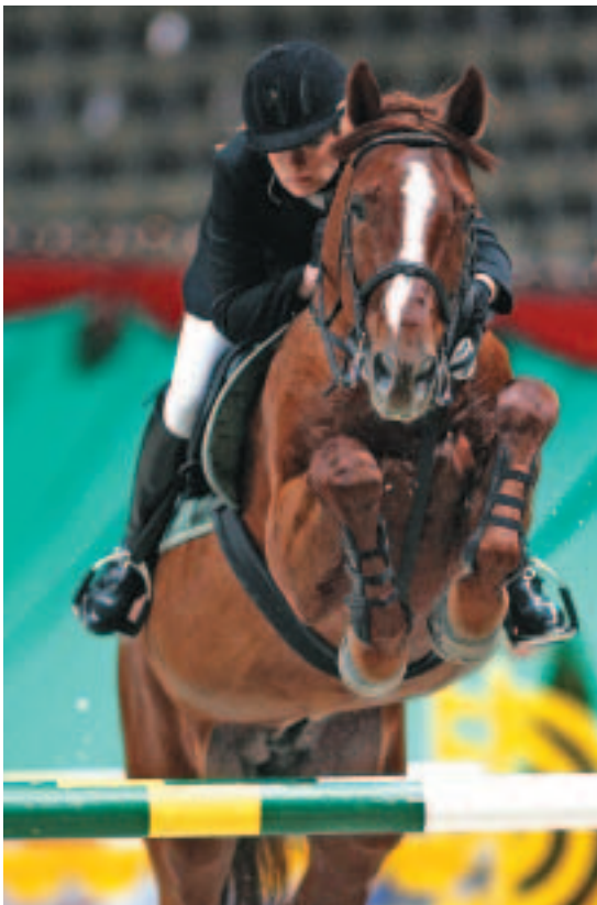
Mit Napolitain ist die Amazone auch im Springsattel bis zur Klasse S siegreich (o.). Für jede Schandtät zu haben: Ob beim...